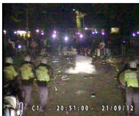
20.51.00 vanuit het publiek wordt vuurwerk naar de ME gegooid

In totaal wordt hiermee bijna een peloton ME gemobiliseerd. Tegelijk worden ook een pelotonscommandant en twee sectiecommandanten gealarmeerd, evenals een groep aanhoudingseenheden (AE). Een half uur later krijgen ook de twee groepen ME die op dat moment al in Haren actief zijn (maar nog niet als ME) de opdracht dat ze om moeten gaan kleden.