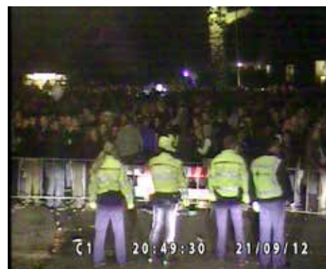
20.49.30 de ME bus komt aanrijden van achter de linie platte petten