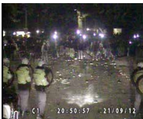
20.50.57 de ME wordt bekogeld