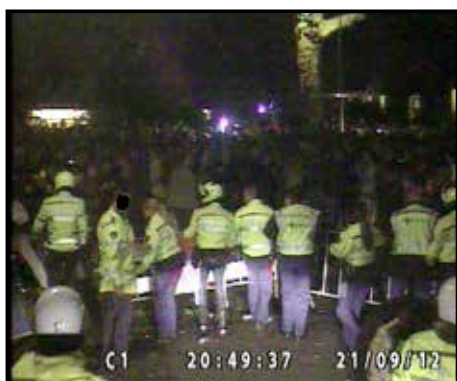
20.49.37 de platte petten zetten de hekken aan de kant, de ME-ers stappen uit hun voertuig, het publiek wijkt naar achteren