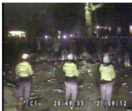
20.49.55 de ME neemt positie in en wordt massaal bekogeld