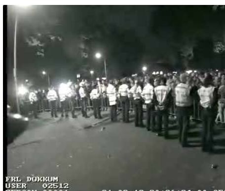
20.26. 00 platte petten staan op linie achter het hek, meinigte jongeren staan voor het hek