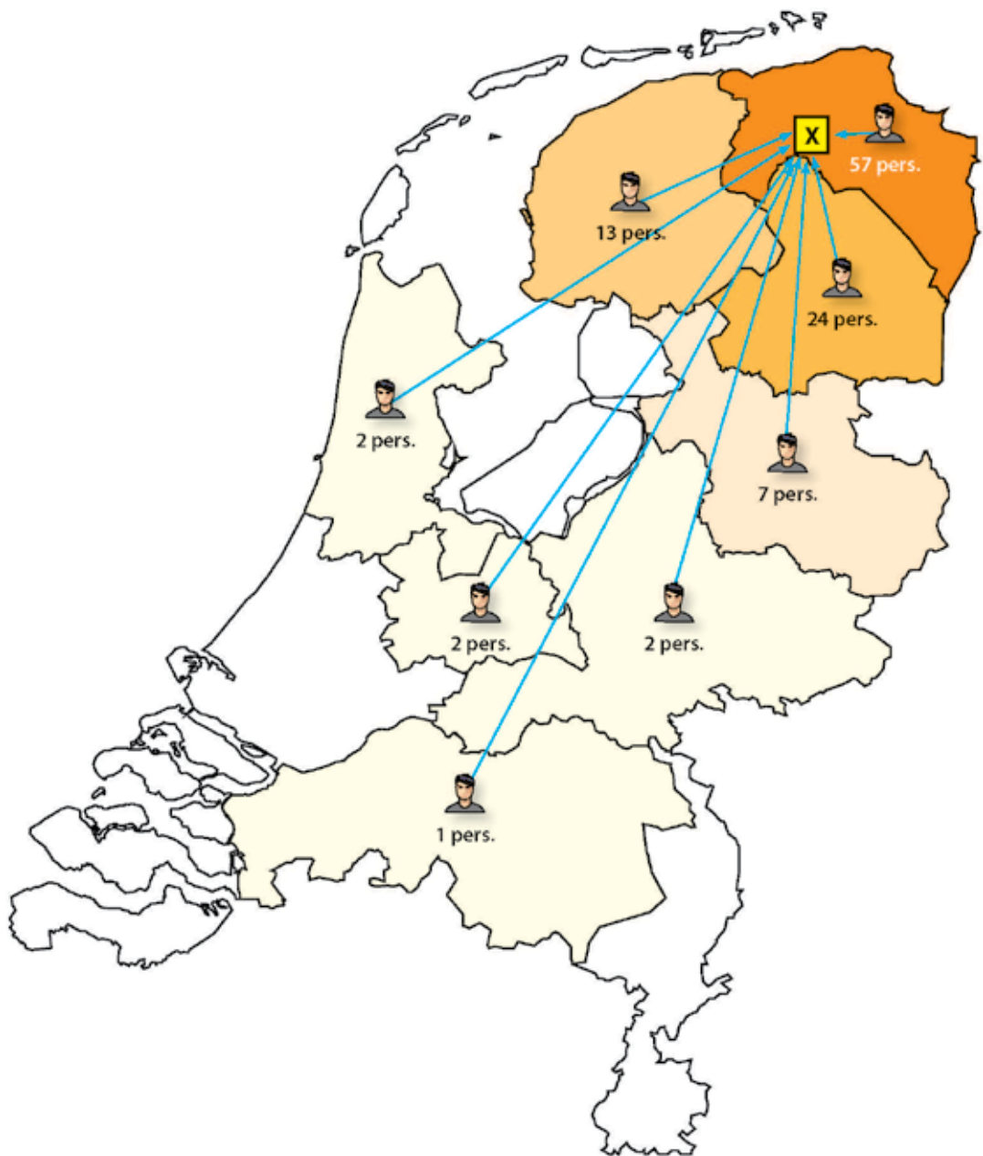
Figuur 1 | Visuele weergave van de woonprovincie van de aangehouden verdachten

Verder blijkt dat de aangehouden verdachten relatief jong zijn en – twee personen uitgezonderd – van het mannelijk geslacht. Gemiddeld zijn de aangehouden verdachten 19,6 jaar oud; drie van de jongste aangehouden verdachte zijn ten tijde van de ordeverstoring veertien jaar oud, de oudste is 40 jaar. De modus c.q. vaakst voorkomende leeftijd van aangehouden verdachten bedraagt 19 jaar (n=21). Uit tabel 1 6 blijkt dat de meeste verdachten (61%) tussen de achttien en 25 jaar oud zijn ten tijde van de ordeverstoring. Iets meer dan een kwart van de aangehouden relschoppers (28%) is op