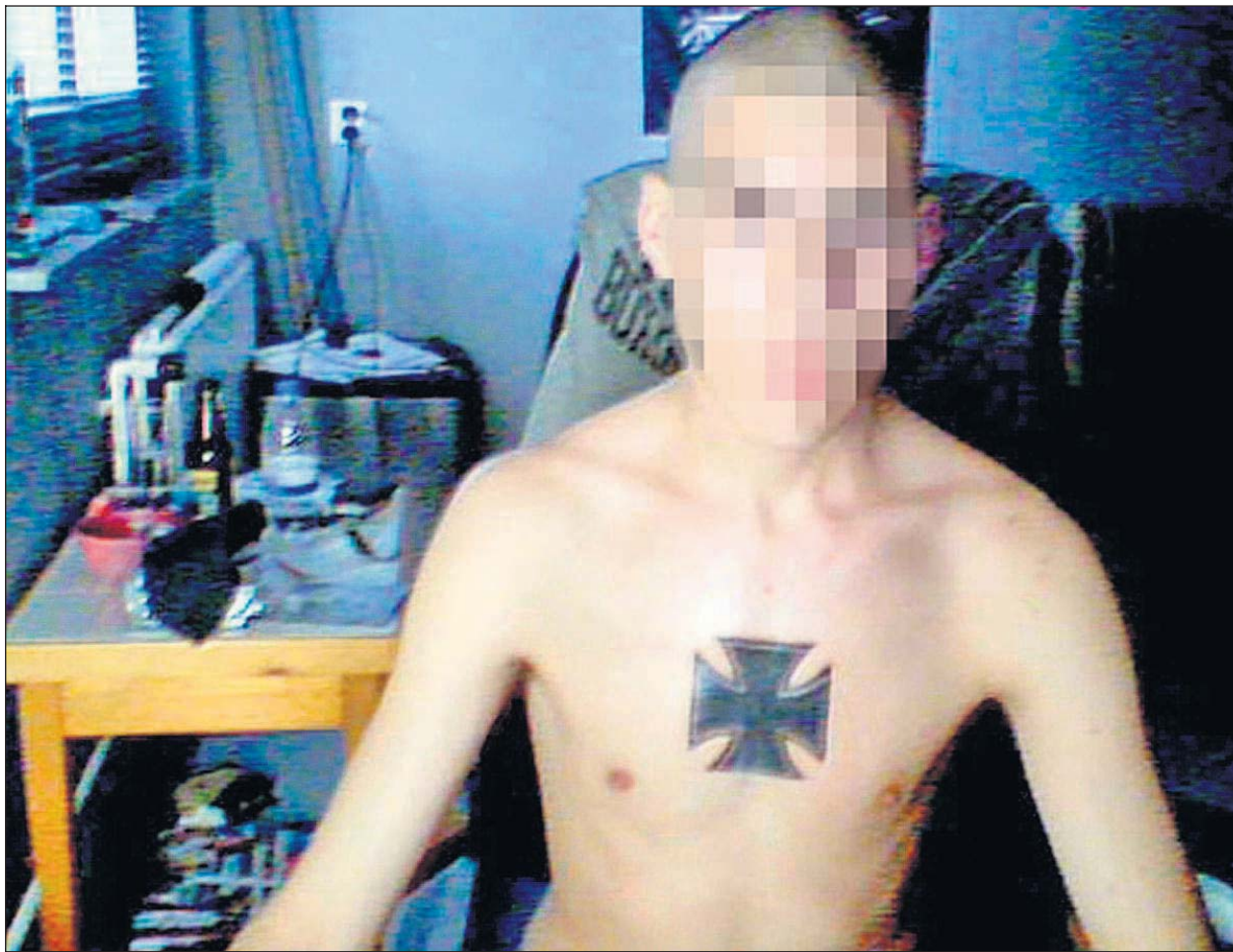
Een onherkenbaar gemaakt portret van een jongere die Hyves gebruikt voor rechts-extremistische uitingen.